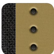
098 Stoff Schwarz/Sand