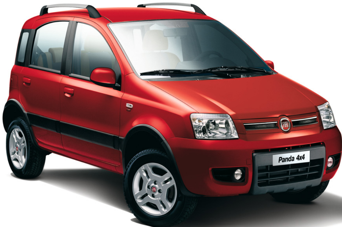
Abbildung enthält Sonderausstattung.

Egal, wohin Sie wollen: Im Fiat Panda Classic 4x4 hält Sie fast nichts auf. Warum? Ganz einfach: Ein proaktives Allradsystem mit serienmäßigem ABS und EBD bietet gute Traktion. Angetrieben wird der Fiat Panda Classic 4x4 durch einen 1,3-Liter Multijet 16V Dieselmotor mit 55 kW (75 PS)* oder einem 1,2-Liter Benzinmotor mit 51 kW (69 PS)*. Außerdem glänzt der Panda 4x4 mit Fahrer- und Beifahrerairbags, Seitenschutzleisten, Servolenkung, einem höhenverstellbaren Fahrersitz sowie einer Zentralverriegelung mit Funkfernbedienung. Bereit, grenzenlose Freiheit zu erleben?