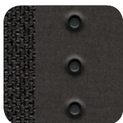
100 Stoff Schwarz