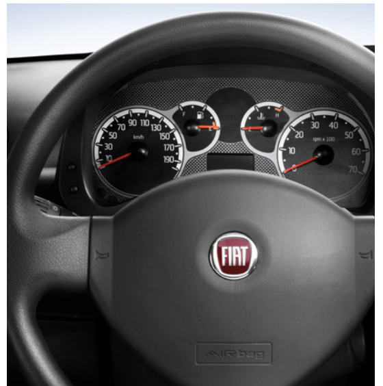
Abbildung enthält Sonderausstattung.

Zentralverriegelung oder bequeme Sitze, die eine erhöhte Sitzposition bieten, freuen. Auch das Armaturenbrett mit seinen gut ablesbaren Instrumenten und Anzeigen überzeugt durch Übersichtlichkeit und einen unverwechselbaren Stil. Keine Frage, in einem Fiat Panda Classic steckt alles, was Spaß macht und nützlich ist. Und das zu einem unschlagbaren Preis.