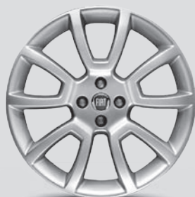
18" Leichtmetallfelgen mit 10 Speichen, OPT. 435