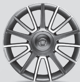
17" Leichtmetallfelgen mit 15 Speichen, OPT. 432