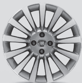
17" Leichtmetallfelgen mit 13 Speichen, OPT. 433