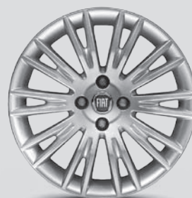
16" Leichtmetallfelgen mit 20 Speichen, OPT. 439