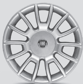
16" Leichtmetallfelgen mit 14 Speichen, OPT. 431